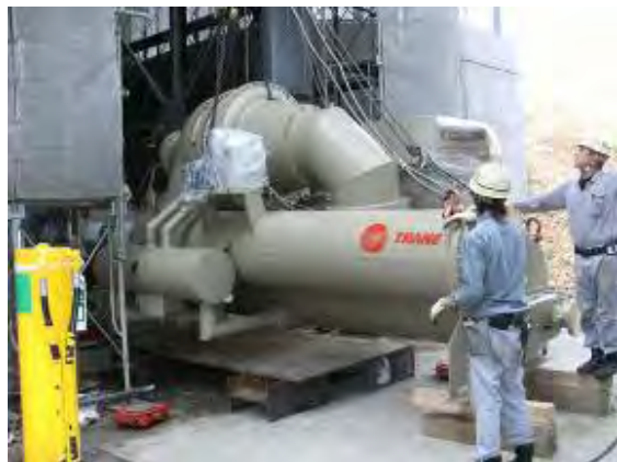
ターボ冷凍機据付