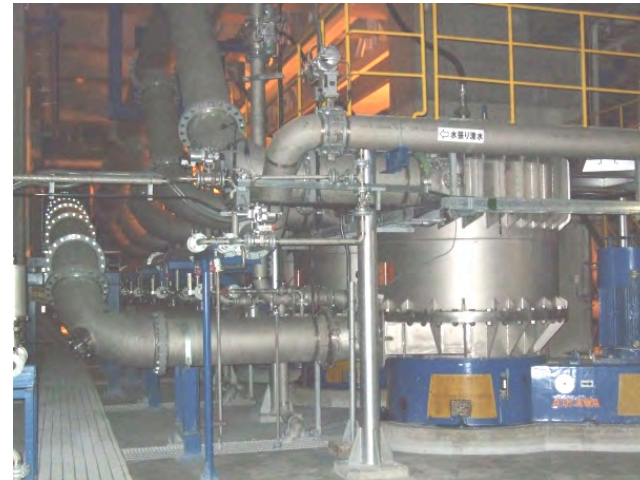
プラント機器据付