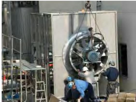
建屋陽圧化ユニット据付