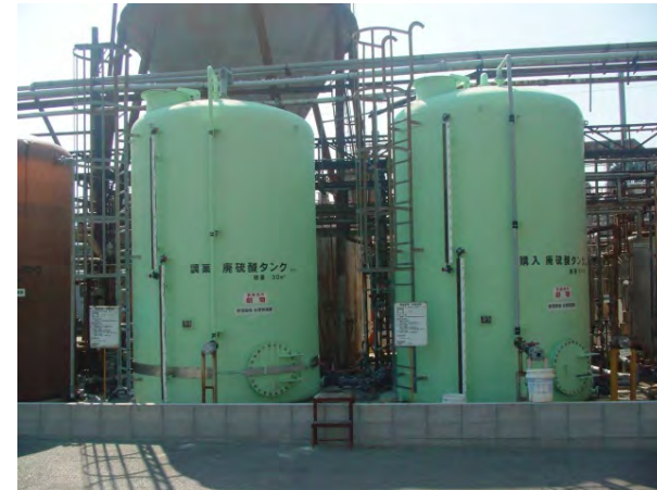
FRPタンク 製作・据付工事