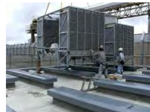
クーリングタワー据付