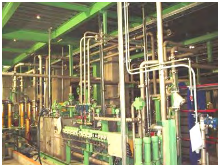
油圧ユニット据付