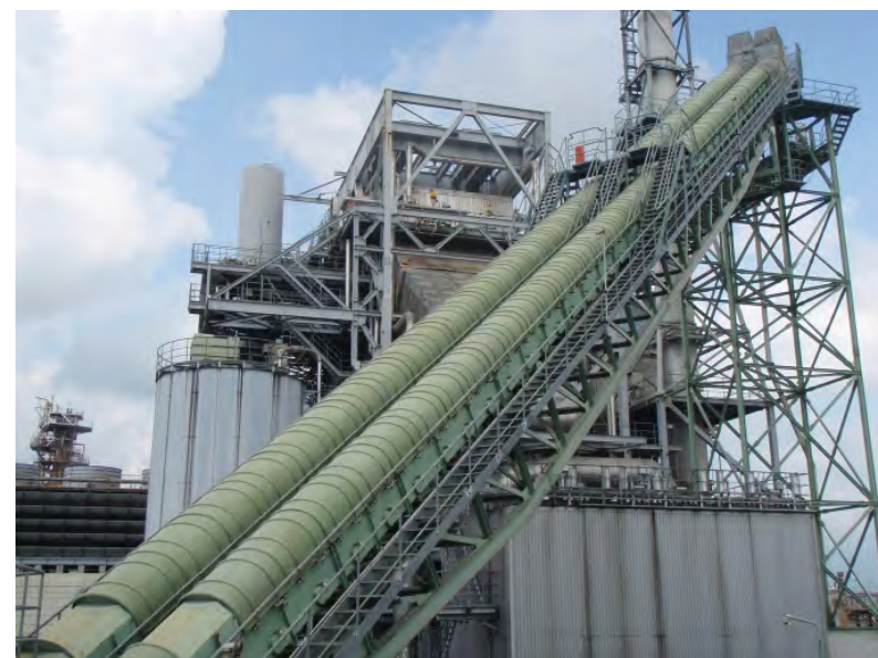
ボイラ 燃料ハンドリング設備 据付工事