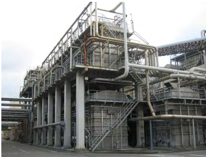
古紙リサイクル 脱墨設備 据付工事

フロー、配置などの基本設計から、機器手配、据付施工、検査、試運転まで、トータルエンジニアリング受注が可能。