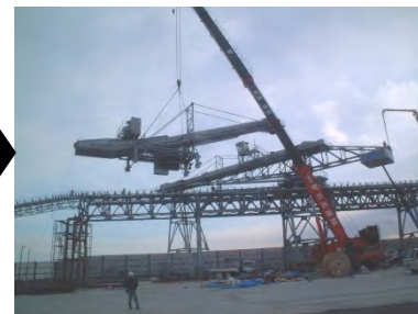
回転式コンベヤ据付